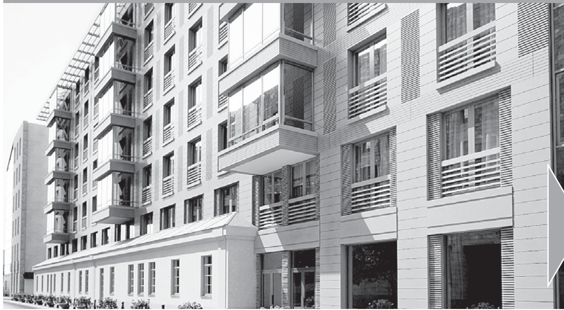
Вид Кавалергардской улицы к 2016 году (эскиз проекта предоставлен ООО «Реформа»).