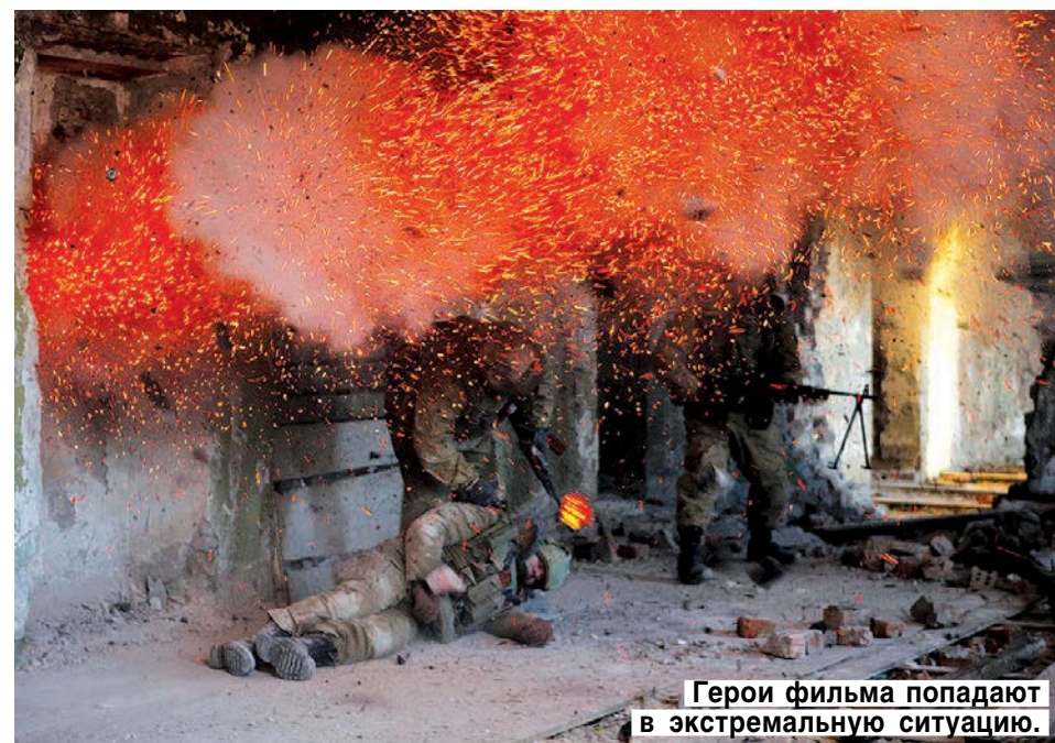
Герои фильма попадают в экстремальную ситуацию.

«Осколки» будут закончены весной этого года. Фильм станет первой частью 8-серийной истории. В других новеллах будет рассказано о второй кампании, истории старика и Сергея до начала войны, разбившей их жизнь и жизнь страны на две части.