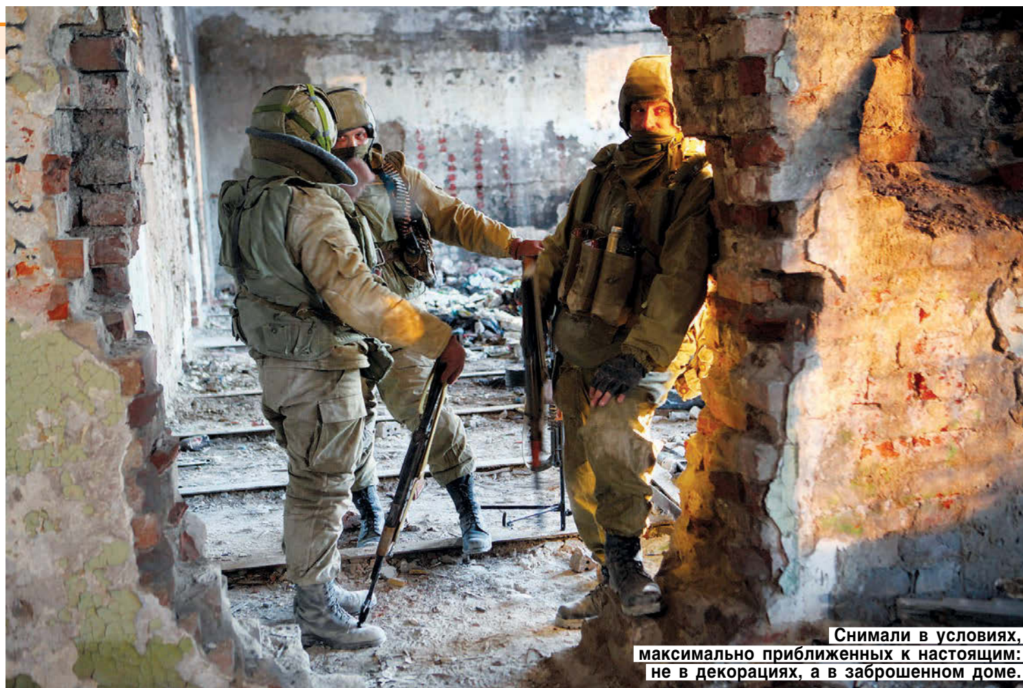
Снимали в условиях, максимально приближенных к настоящей: не в декорациях, а в заброшенном доме.