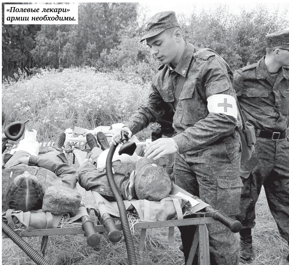
«Полевые лекари» армии необходимы.

ВО ВМЕДА ПРОЙДЕТ ПЕРВЫЙ В СОВРЕМЕННОЙ ИСТОРИИ НАБОР КУРСАНТОВ ДЛЯ ОБУЧЕНИЯ ФЕЛЬДШЕРСКОМУ ДЕЛУ