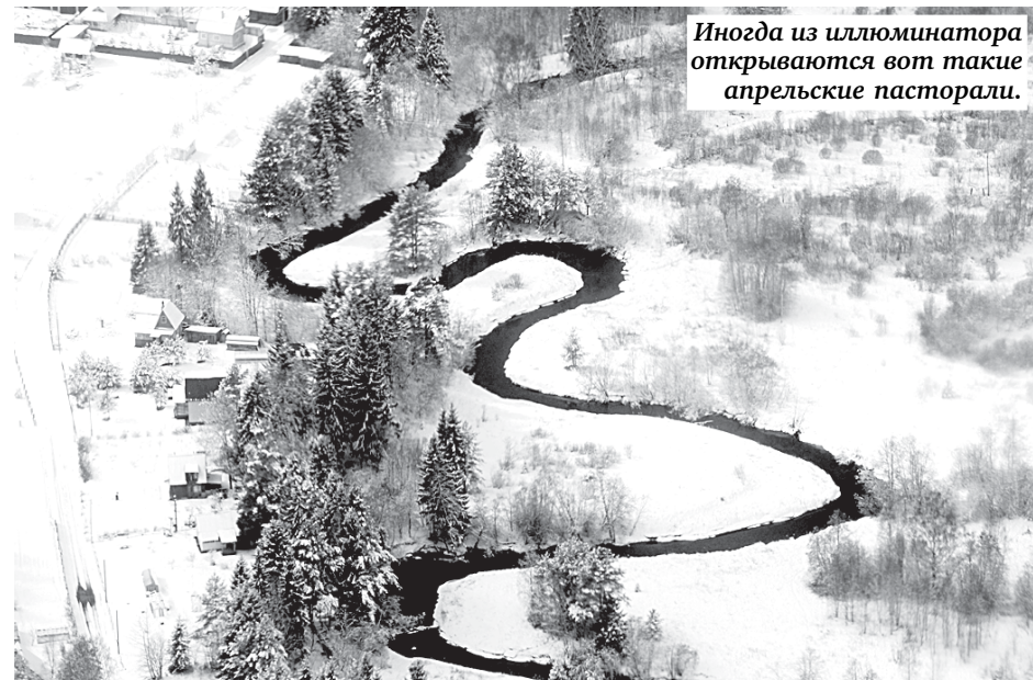
Иногда из иллюминатора открываются вот такие апрельские пасторали.

В Петербурге опять метет колючий снег. Радужным апрелем и не пахнет. И все же, несмотря на это, вылетать на гидрологическую разведку нынешней весной спасателям, вероятно, больше не требуется.