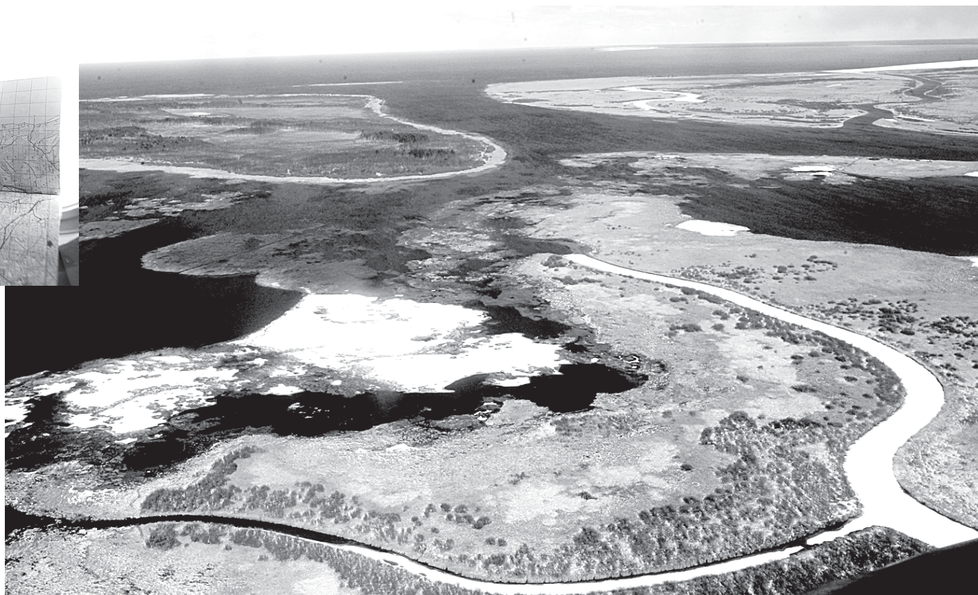
В Тихвинском и Лодейнопольском районах некоторые реки вскрывались не до конца. Зато Ладога — чистая как стеклышко!

Насчет ситуации все, собственно, просто. Если реки еще в спячке, нужно занести ледовые участки на карты, чтобы знать, где в случае чего ждать ЧП. Впрочем, во время