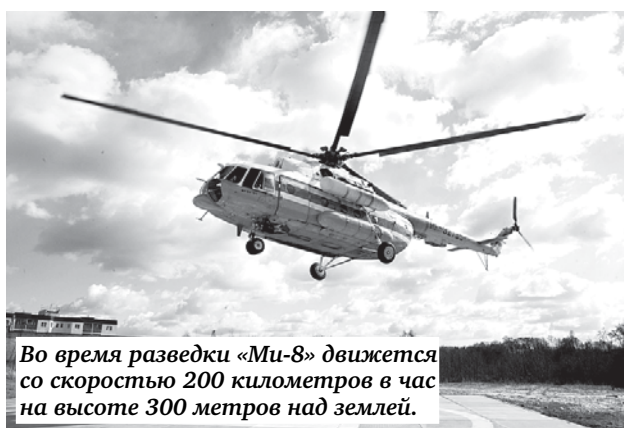
Во время разведки «Ми-8» движется со скоростью 200 километров в час на высоте 300 метров над землей.

Первый пункт — бухта Петрокрепость. Ладога приближается неторопливо и сурово, как прилив. Сначала не веришь глазам — до горизонта ни льдинки! А ведь, кажется, еще неделю назад все твердили, что ладожские рыбаки не уходят с насиженных мест и, отрываясь, отправля-