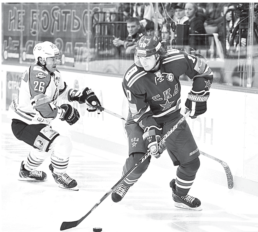
Армейцы должны прервать серию неудач.