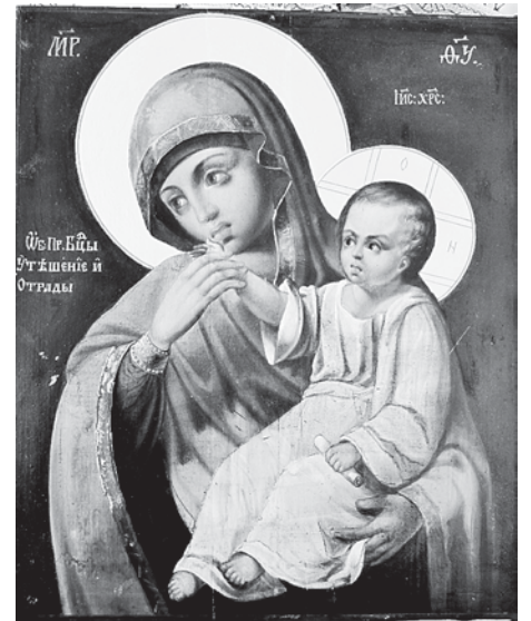
«Отрада и Утешение».