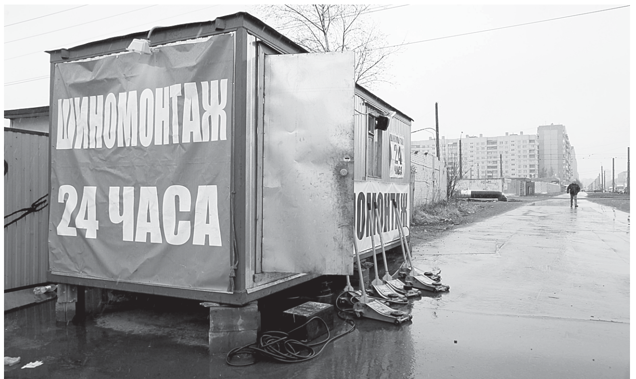
Вагончик-мастерская прижался к забору на краю широкого тротуара.

— Скажите, пожалуйста, — обращаемся к нему, — у вас есть разрешение на организацию мастерской в этом месте? Жители жалуются, что она мешает пешеходам!