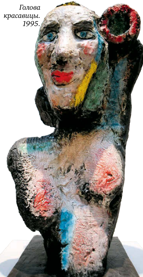
Голова красавицы. 1995.