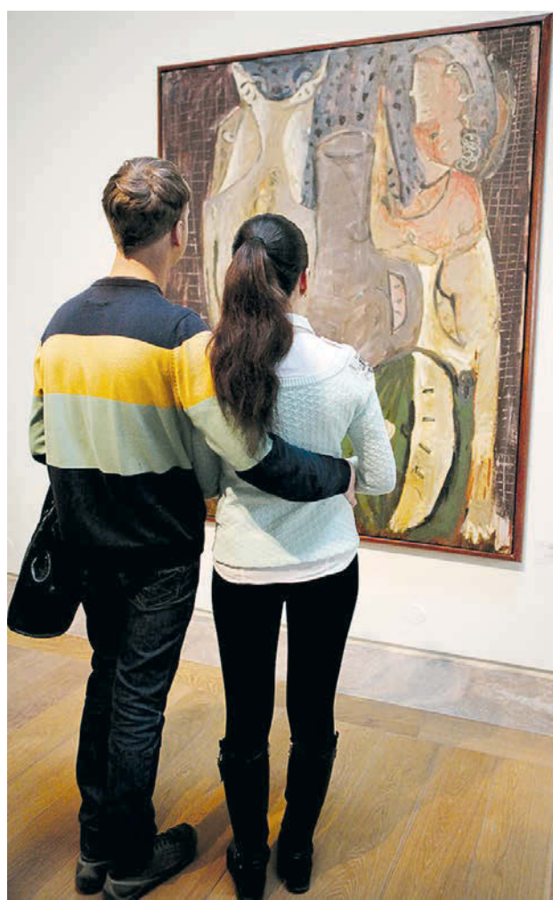
«И картины, и скульптуры — это только толчки к размышлению».