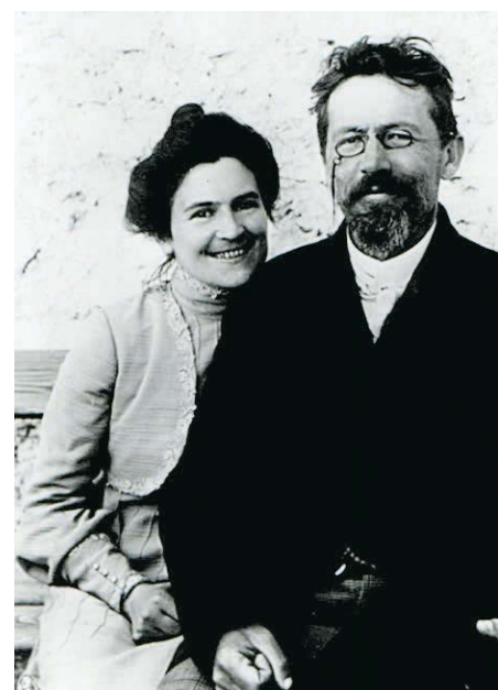
Ольга Книппер и Антон Чехов на отдыхе в Крыму.

Крым связан с Чеховым и его творчеством, пожалуй, не меньше, чем Москва и Петербург. Первый раз писатель побывал здесь летом 1888 года. Исследователи полагают, что пейзажи Крыма отразились в повести Чехова «Черный монах». Летом следующего года Чехов провёл три недели в Ялте, работая над «Скудной историей».