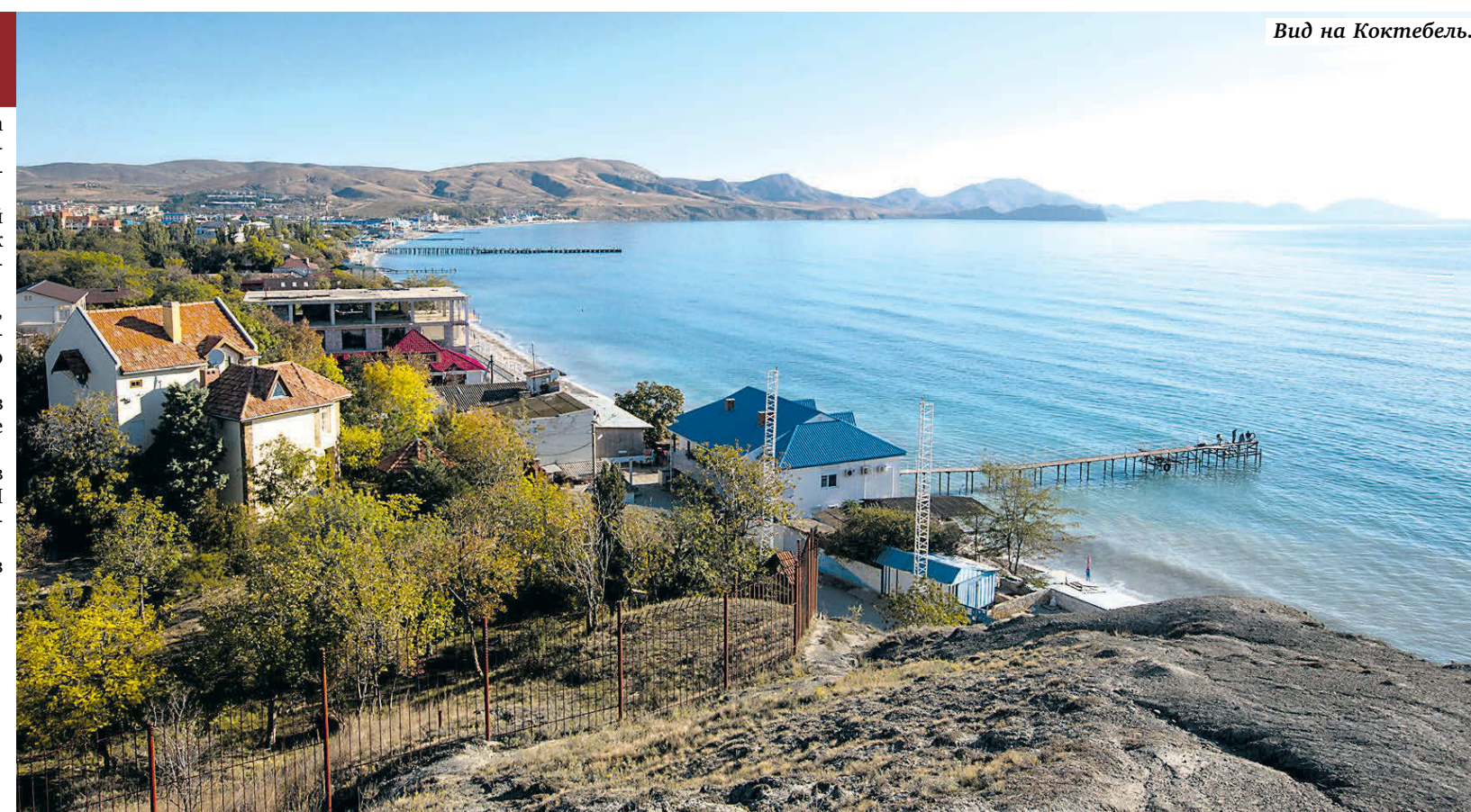
Вид на Коктебель.

Как в раковине малой — океана Великое дыхание гудит, Как плоть ее мерцает и горит Отливами и серебром тумана, А выгибы ее повторены В движении и завихре волн, — Так вся душа моя в твоих заливах, О, Киммерии темная страна, Заключена и преобращена.