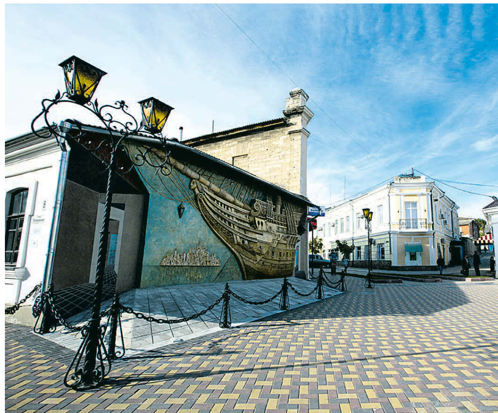
Дом-музей Александра Грина в Феодосии.

Но, как сама бессмертная Россия, Став в эти дни сильнее, чем Голиаф, Я, зубы сжав и муки пересилив, Восстал из гроба, смертью смерть поправ.