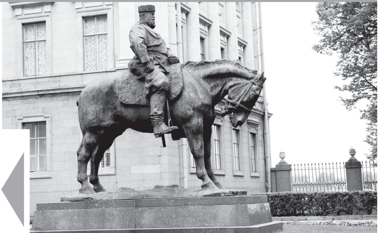
Памятник Александру III, изначально установленный на Знаменской площади, сегодня приютился во дворе Мраморного дворца.

СУДЬБА МОНУМЕНТА БУДЕТ РЕШАТЬСЯ... НА ОБЩЕГОРОДСКОМ РЕФЕРЕНДУМЕ, А ТЕМ ВРЕМЕНЕМ РУССКИЙ МУЗЕЙ ВЫСТУПИЛ С ПОДДЕРЖКОЙ ЭТОЙ ИДЕИ