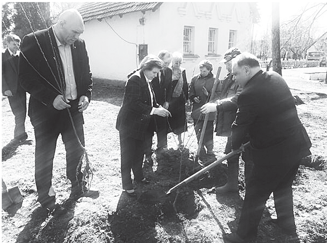
Николай Валуев праздничные выходные провел активно.

А ВИКТОРИЯ ЛОПЫРЕВА ДАЛА УСТАНОВКУ ФЕДОРУ СМОЛОВУ