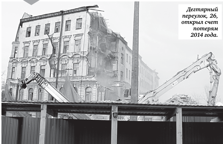
Дегтярный переулоч, 26, открыл счет потерям 2014 года.