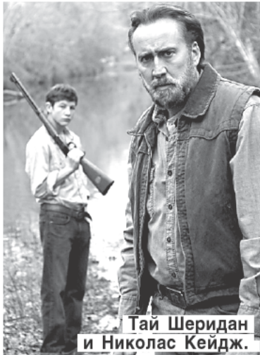
Тай Шеридан и Николас Кейдж.

ДРАМА. Между подростком из асоциальной семьи и бывшим бандитом, недавно вышедшим на свободу из тюрьмы, завязывается дружба.