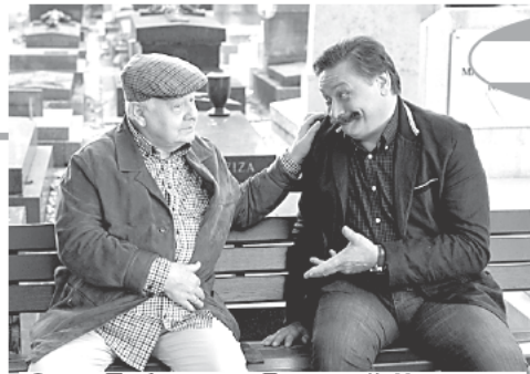
Олег Табаков и Дмитрий Назаров.