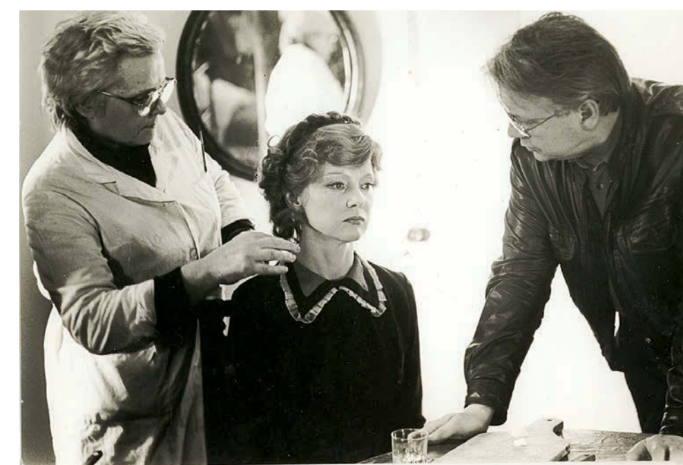
Гримеры «Ленфильма» всегда славятся своим мастерством. На фото сверху: Людмила Гурченко на съемках фильма «Аплодисменты, аплодисменты...». На фото внизу: Светлана Иванова на съемках фильма «Поклонники».

ем для окраски, со стиральной машиной, сушильным шкафом, поддонами для мытья...), вторая — для изготовления париков, усов, бород и т. д. Планируется закупка специальных машин для шитья постыжа, пока эта огромная работа ведется вручную. Также нужны специальные шкафы для хранения изделий. Запланированы также ремонт и переоборудование мастерской спецэффектов.