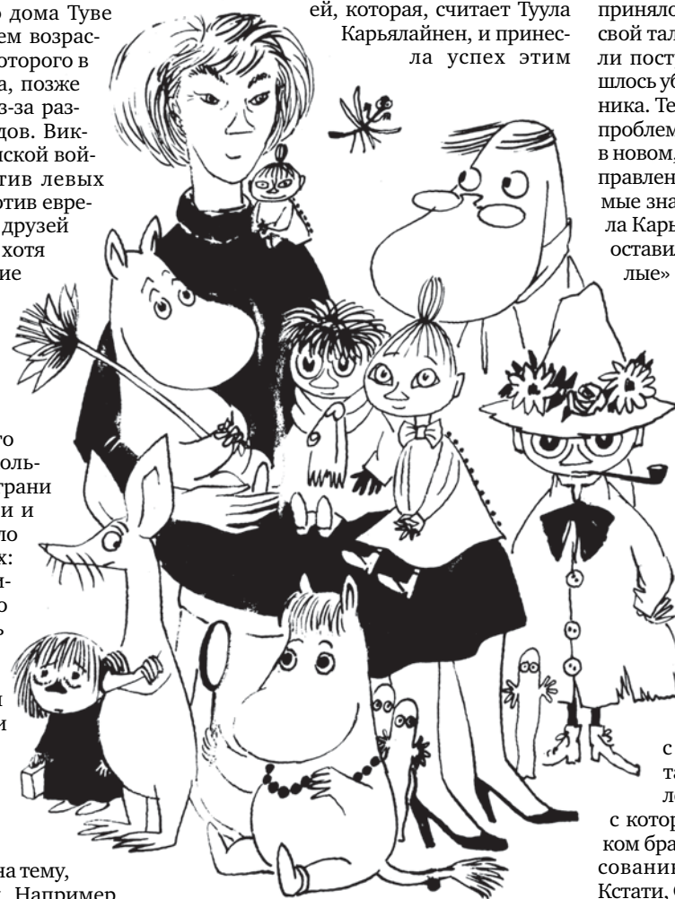
Автопортрет Туву Янссон с любимыми героями Муми-долины.