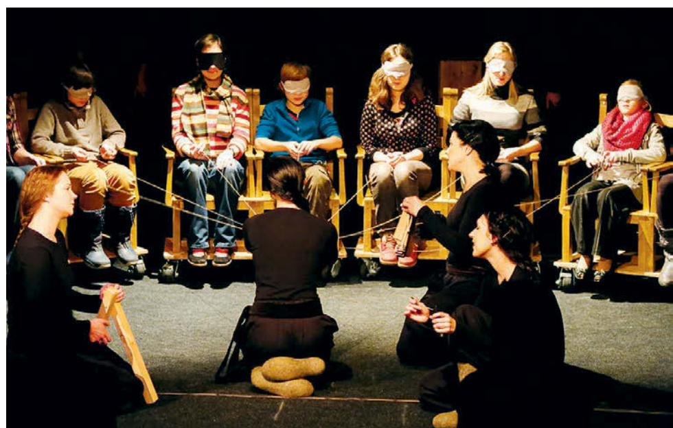
Даже зрячие зрители могут попробовать смотреть спектакль с закрытыми глазами.