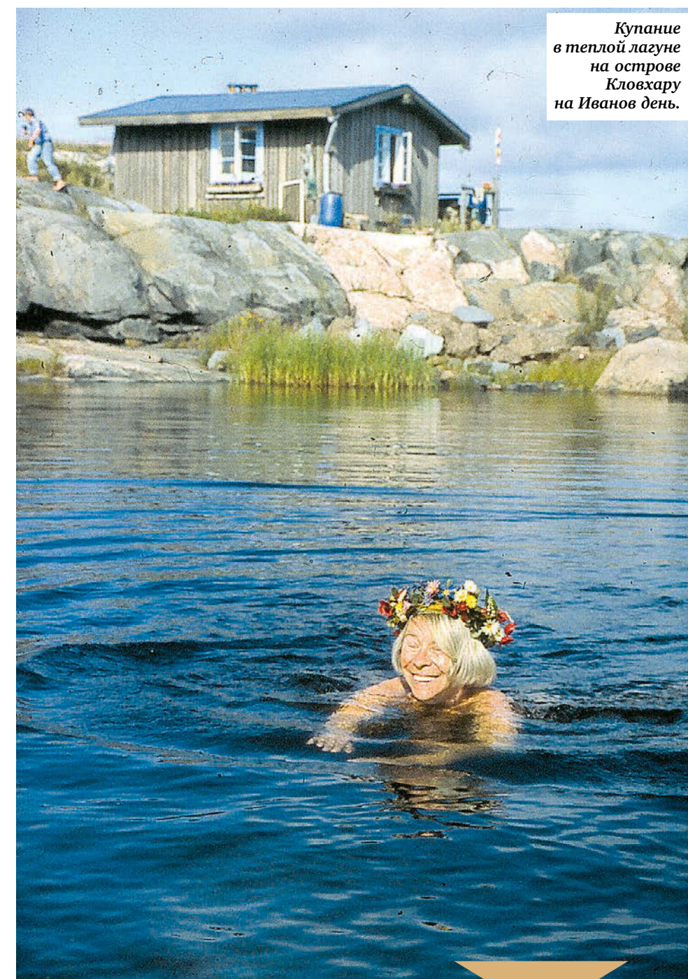
Купание в теплой лагуне на острове Кловхару на Иванов день.