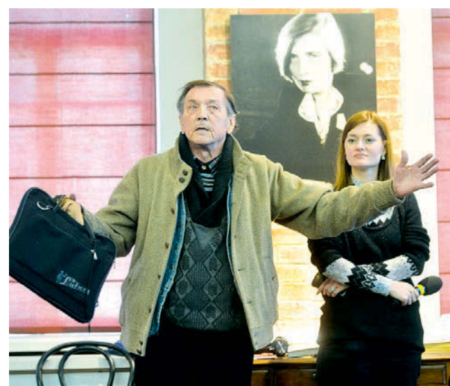
Посетители благодарят за проект Балтийскую медиа-группу.