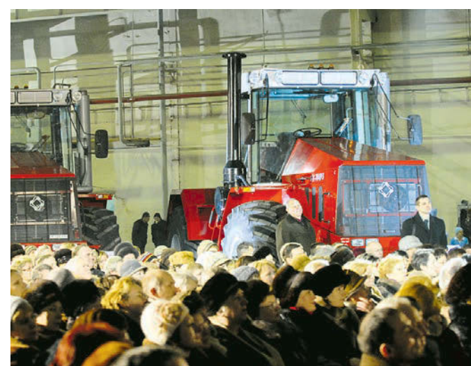
Кировский завод — одно из самых известных предприятий Петербурга, славящееся традициями.