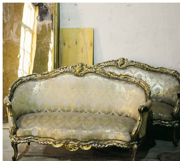
Студия хранит уникальные предметы, используемые в съемках исторического кино.

Именно такими перед нами предстали декорации к съемкам исторического фильма «Екатерина Великая», воспроизводящие интерьеры Царскосельского дворца. Однако виду волеизъявления компании, работающей над фильмом, подробностей узнать так и не удалось, но зато приятно было в очередной раз удивиться мастерству ленфильмовцев, способных моделировать в рамках своих помещений чуть ли не целые миры.