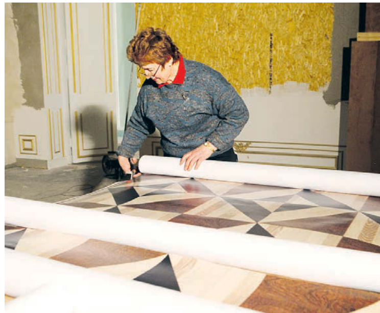
У декораторов «Ленфильма» теперь много работы.

Старейшая киностудия в России стала еще старше, отметив в минувшую среду свой новый день рождения: цепочка ее истории протянулась дальше, чем 1918 год и декрет Луначарского.