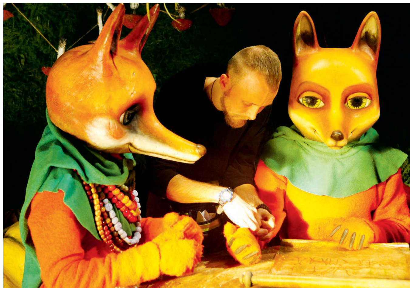
Персонажи «Самого рыжего лиса».