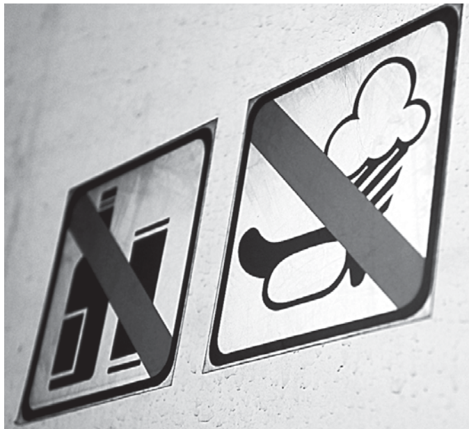
Далеко не все пассажиры возражают против запрета на еду в автобусе. Запахи чужой пищи многим доставляют дискомфорт и даже вызывают тошноту.

Однако трудности переезда начались сразу. Буквально с первых минут поездки. Как там Wi-Fi! Во-первых, как оказалось, билеты достались совсем не на фирменный экспресс, а на выдавший виды автобус, потрепанные сиденья которого хранили на своей обивке свидетельства многих житейских бурь. А его узкие проходы были практически непроходимы для пассажиров с вещами. Их приходилось нести перед собой на руках. Многие так и входили в салон — в одной руке ребенок, в другой — дорожная