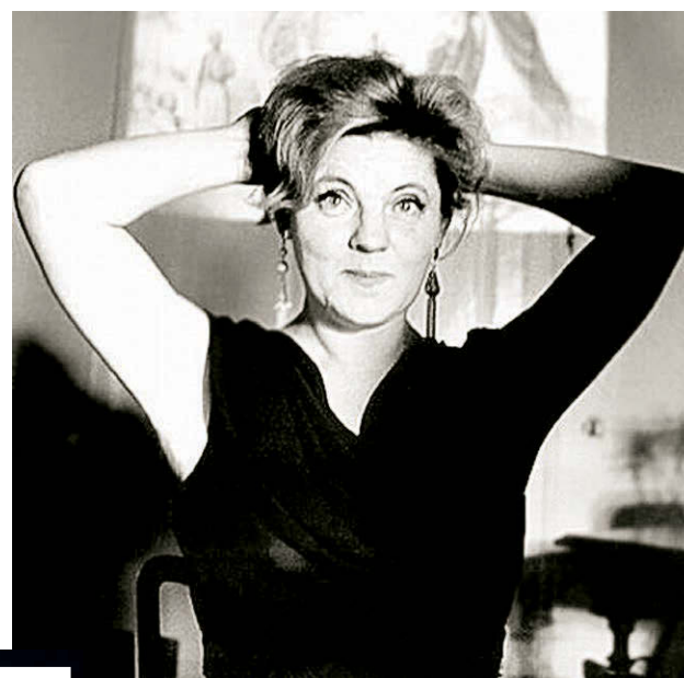
В фильме Киры Муратовой «Долгие проводы».

ли не копание в грязном белье. В этом году у спектакля тоже юбилей — 55 лет. И сегодня иные очевидцы убеждены: «Пять вечеров» — может быть, лучшее творение Товстоногова — стали «обыкновенным чудом» советского театра. Недостигаемой высотой поднимала Шарко фабричную женщину Тамару. И по значению эту роль можно смело поставить в один ряд с выдающимися ролями в товстоноговском театре тех лет: с Мышкиным — Смоктуновским, горьковским Черкуном — Луспекаевым, Чацким — Юрским. Эта роль в творческой судьбе актрисы стала