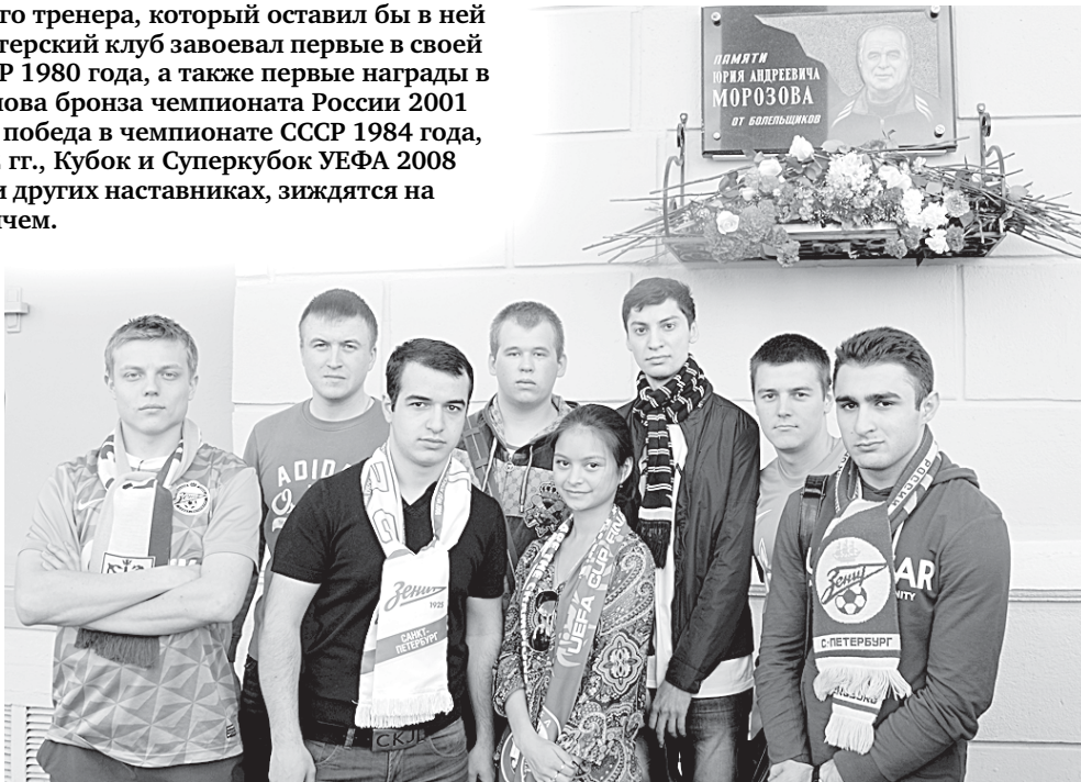
Вместе с ветеранами память тренера почтили молодые ребята из студенческого фанклуба «Зенита» СПбГЭУ.

А во-вторых, доверие к молодым футболистам, воспитанникам местных школ. Способность открывать новые таланты и воспитывать их. Не только в Ленинграде — Петербурге, но и в Киеве в «Динамо» и Москве в ЦСКА. Назовем лишь питерских футболистов, кому Юрий Андреевич дал путевку в жизнь. Это начинавшие у Морозова чемпионы СССР 1984 года Михаил Бирюков, Владимир Долгополов, Алексей Степанов, Владимир Клементьев, Валерий Брошин, Николай Ларионов, Сергей Веденеев, Юрий Желудков, Юрий Герасимов... И творцы побед «Зенита» XXI века — Вячеслав Малафеев, Владимир Быстров, Игорь Денисов, Андрей Аршавин, Александр Кержаков. Они составили костяк того «Зенита», который после Морозова завоевывал бронзу чемпионата России 2003 года при Властимиле Петржеле, золото 2007 года при Дике Адвокаате и оба Еврокубка — при нем же. И оба чемпионских титула «Зенита» при Лучано Спаллетти без воспитанников Морозова вряд ли состоялись бы.