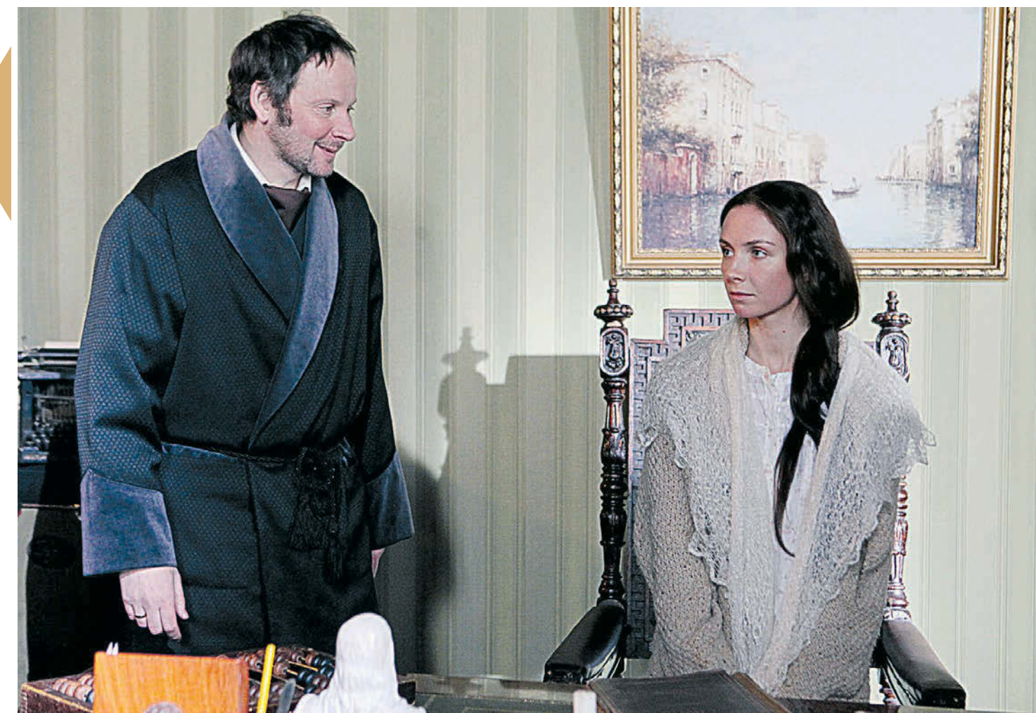
Артисты намерены показать подлинность чувств.