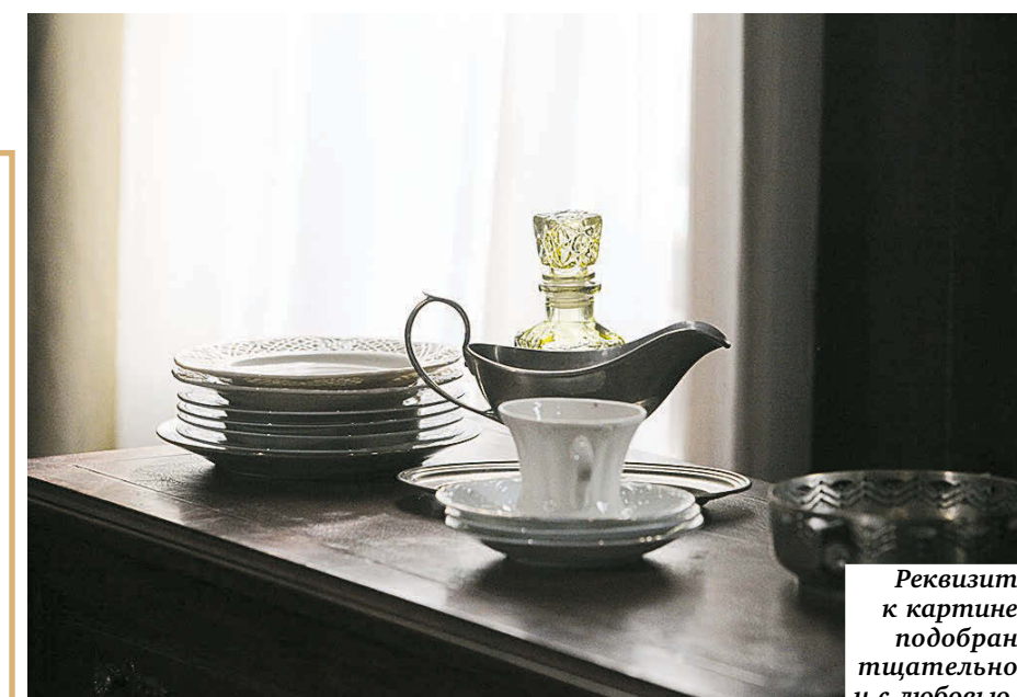
Реквизит к картине подобран тщательно и с любовью.

Если в кадре есть камин, должен быть и огонь