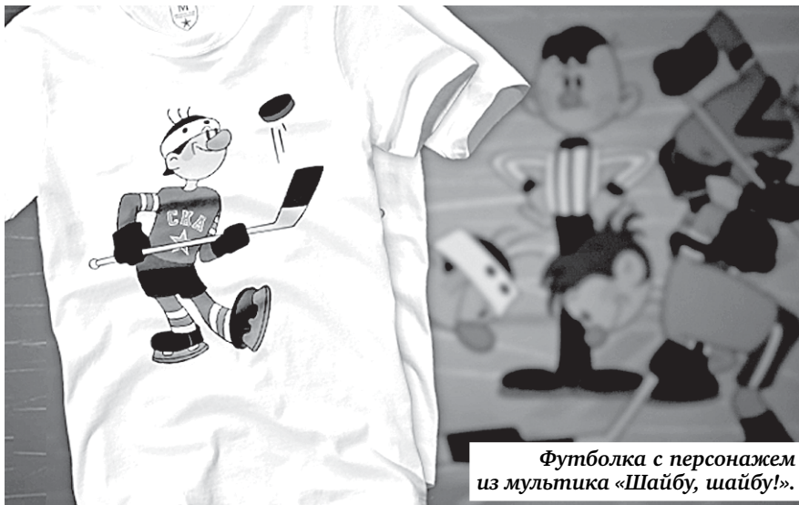
Футболка с персонажем из мультфильма «Шайбу, шайбу!».

Контракт окажется существенным подспорьем для единственной в стране студии мультфильмов, которая переживает не лучшие времена. Кроме единовременной выплаты, размер которой не разглашается, студия также будет получать процент от продажи