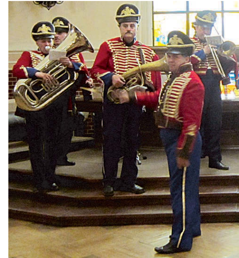
Военный оркестр приглашает на бал!

Тем временем в центральном зале музея раздаются звуки духовых инструментов. Начинается бал! Музыканты Западного военного округа в старинных военных мундирах играют мазурку, вальс, менуэт. Экскурсанты, поборов своих экскурсоводов, стекаются в зал на звуки прекрасной музыки. Переодетые в балные платья артисты и настоящие кадеты в форме приглашают детей и взрослых на танец. Одни вальсируют блестяще, другие совсем неумело, но аплодисменты достаются всем. Музей Суворова впервые участвует в «Ночи музеев», но получается у него так здорово, что в это даже не верится.