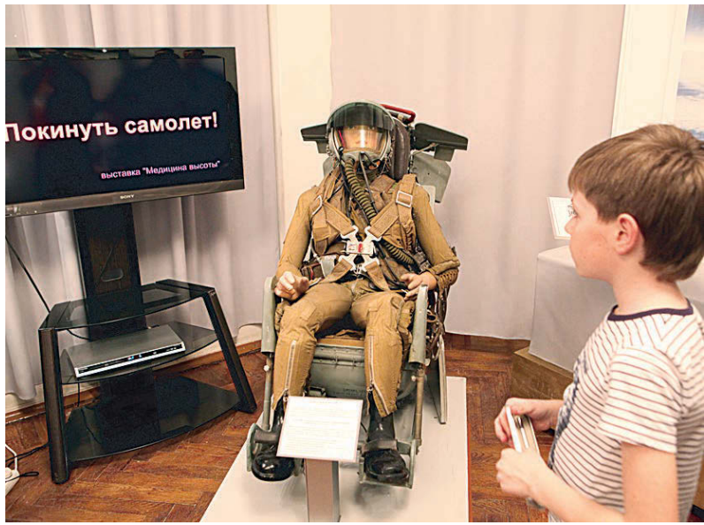
Постоянная экспозиция музея без зрителей не останется.