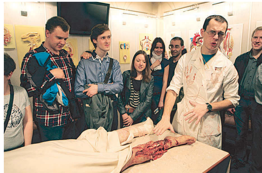
Не пугайтесь, на прожекторском столе — муляж.

В другом зале — те самые оптические иллюзии. На большом экране показываются всякие точки, за которыми надо следить, всякие прямые линии, которые кажутся изогнутыми, — словом, все, чтобы обмануть свой бедный мозг. В отдельном закутке — программа «Смотри в оба»: тут проверяют цветоощущение и другие параметры зрения. Можно узнать, например, что ты дальтоник или еще кто-нибудь.