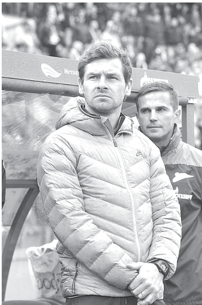
Тренеру «Зенита» предстоит проанализировать закончившийся сезон.

Следует, однако, отметить, что, как это ни парадоксально, несмотря на игру «ни шатко ни валко», «Зенит» начиная с 8-го тура ни разу не опускался ниже второй строчки чемпионата. И только когда команда стала показывать абсолютно безвольную игру, как