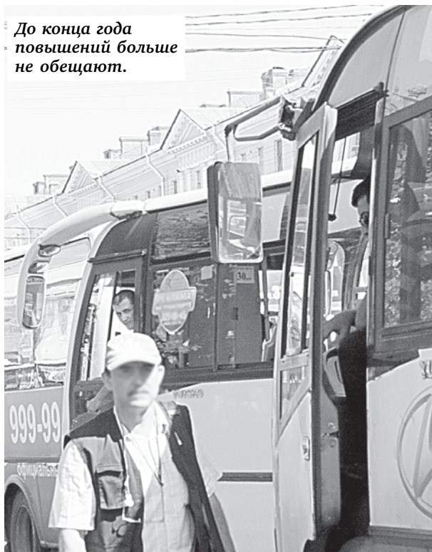
До конца года повышенный больше не обещают.

С ПРОШЛОЙ СУББОТЫ БОЛЬШИНСТВО ПИТЕРСКИХ МАРШРУТОЧНИКОВ НАЧАЛИ ВОЗИТЬ ПассажиРОВ ЗА 36 РУБЛЕЙ