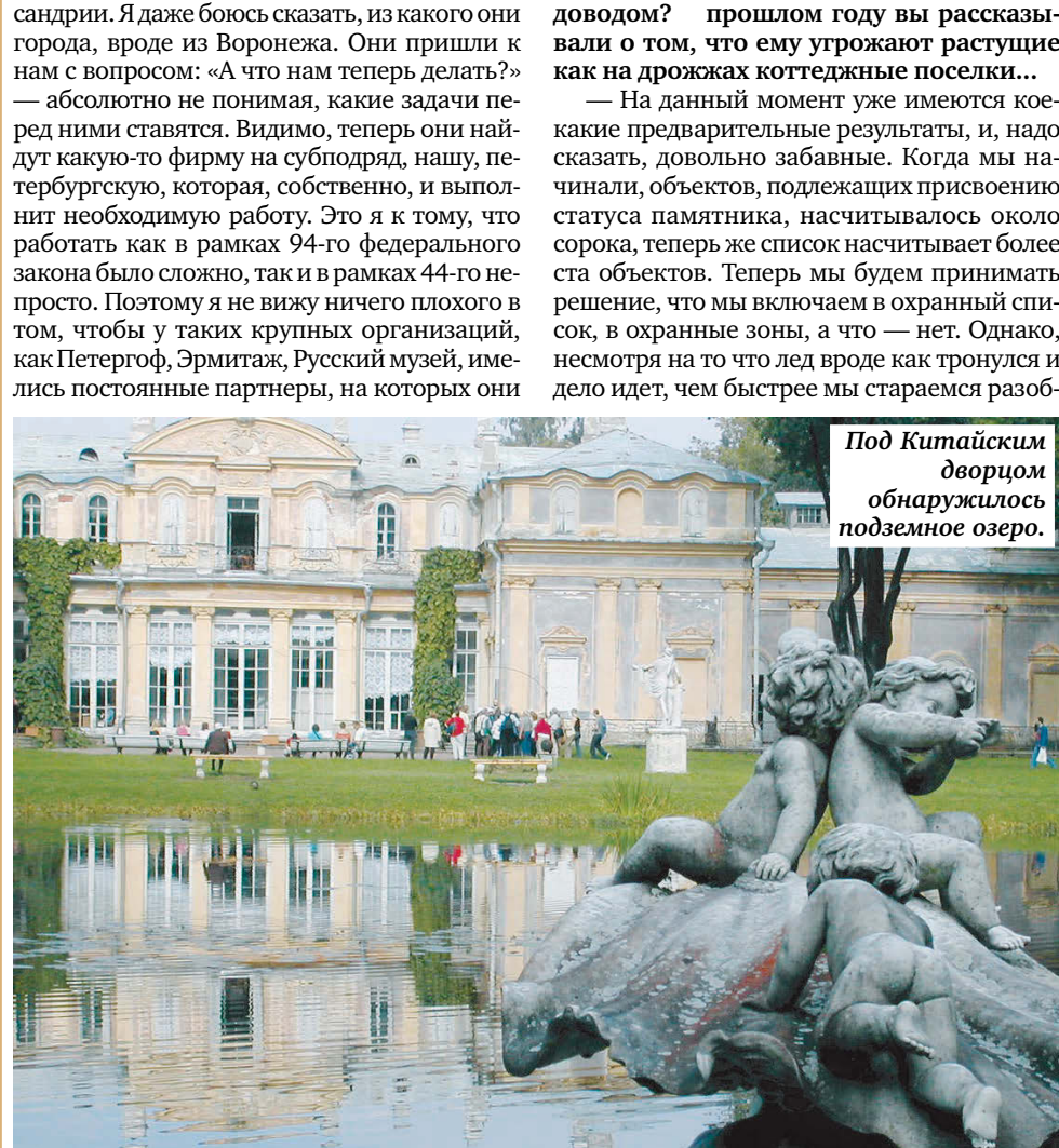
Под Китайским дворцом обнаружилось подземное озеро.

— Причал был закрыт на реставрацию в декабре, хотя мог бы закрыться и в сентябре, но деньги стали поступать, увы, только в конце года. И вот, представьте себе, такой важный для города объект с весьма обширным объемом работ, который мог бы реставрироваться с сентября по март, все еще в работе и на сегодня мы уже должны подрядчику 67 миллионов, благо эти деньги прямо сегодня должны перевести из Москвы (наш разговор состоялся на минувшей неделе. — Авт.). Это какими должны быть партнеры, чтобы ввиду задолженности они не остановили работы, чтобы нас не подвести. Мы все так же работаем по конкурсу, и кто на него придет — мы не знаем. Например, сейчас к нам пришла группа, которая будет делать инвентаризацию зеленого комплекса Александрия. Я даже боюсь сказать, из какого они города, вроде из Воронежа. Они пришли к нам с вопросом: «А что нам теперь делать?» — абсолютно не понимая, какие задачи перед ними ставятся. Видимо, теперь они найдут какую-то фирму на субподряд, нашу, петербургскую, которая, собственно, и выполнит необходимую работу. Это я к тому, что работать как в рамках 94-го федерального закона было сложно, так и в рамках 44-го не просто. Поэтому я не вижу ничего плохого в том, чтобы у таких крупных организаций, как Петергоф, Эрмитаж, Русский музей, имелись постоянные партнеры, на которых они