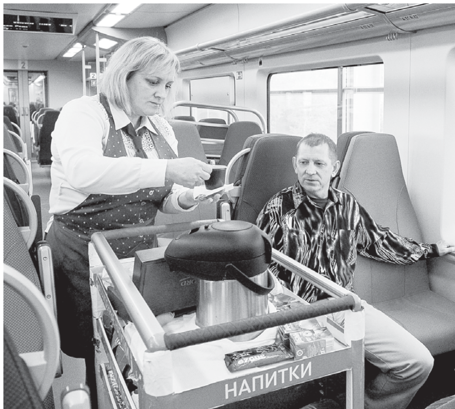
Добираться в аэропорт на экспрессе, безусловно, очень комфортно — но дороговато.

У ЛРТ тоже есть инвестор, но потребуются вложения и от города. Сейчас комитет по инвестициям актуализирует проектную документацию, разработанную в 2011 году. Изменения не критичны — перебор линии от станции метро «Московская» к станциям «Звездная» и «Купчино». Между Пулковом и «Купчино» предполагается семь остановок: собственно сам аэропорт, Пулковское шоссе, Шереметьевская улица, 5-й Предпортовый проезд, «Звездная», проспект Космонавтов и «Купчино». Общая протяженность линии легкорельса составит около 11 километров. Трамвай будет двигаться по линии со скоростью 50 км/ч, и время поездки от аэропорта до станции «Купчино» не превысит 20 минут. На строительство ветки предполагается потратить около трех лет, после чего инвестор получит