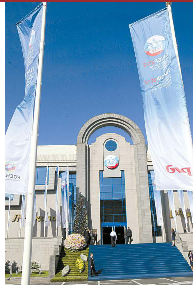
На Васильевском острове ждут гостей.

ЧТОБЫ провести форум на высоком уровне, понадобились немалые средства. Бюджет ПМЭФ составляет 1 125 172 500 рублей, из которых внебюджетные средства, то есть взносы (в зависимости от пакета услуг они варьируются от 236 000 до 295 000 рублей) — это 1 079 382 000 руб., из федеральной же казны будет потрачено только 45 790 500 рублей.