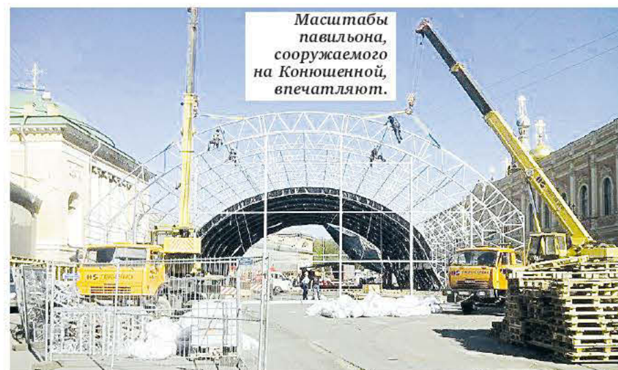
Масштабы павильона, сооружаемого на Коношенной, впечатляют.

Однако, как сообщил вице-губернатор, будет много и бесплатных мероприятий. Они начнутся 24 мая. В этот день Петербург присоединится к общероссийскому празднованию Дня славянской письменности и культуры хором.