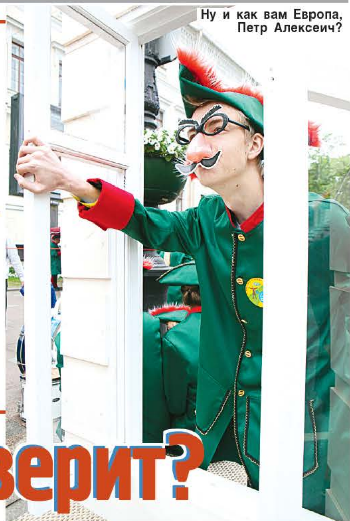
Ну и как вам Европа, Петр Алексеевич?