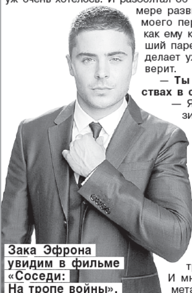
Зака Эфрона увидим в фильме «Соседи: На тропе войны».