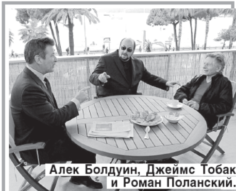
Алек Болдуин, Джеймс Тобак и Роман Поланский.

МУЛЬТФИЛЬМ. Активные и любознательные черные муравьишки обнаруживают брошенную после пикника коробку с сахаром. Дружный отряд муравьишек вместе с божьей коровкой решают переправить лакомство в муравейник.