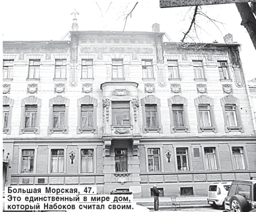
Большая Морская, 47. Это единственный в мире дом, который Набоков считал своим.