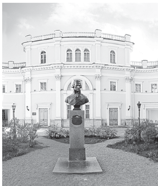
Музей-усадьба приятно радует глаз после обновления.

А еще в музее открыта выставка «Милый друг. Веер в