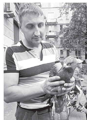
Сокола-осода спасали всем миром.

А на днях на территории приюта состоялся фестиваль «Верность» — при поддержке Общественного совета при правительстве Санкт-Петербурга по