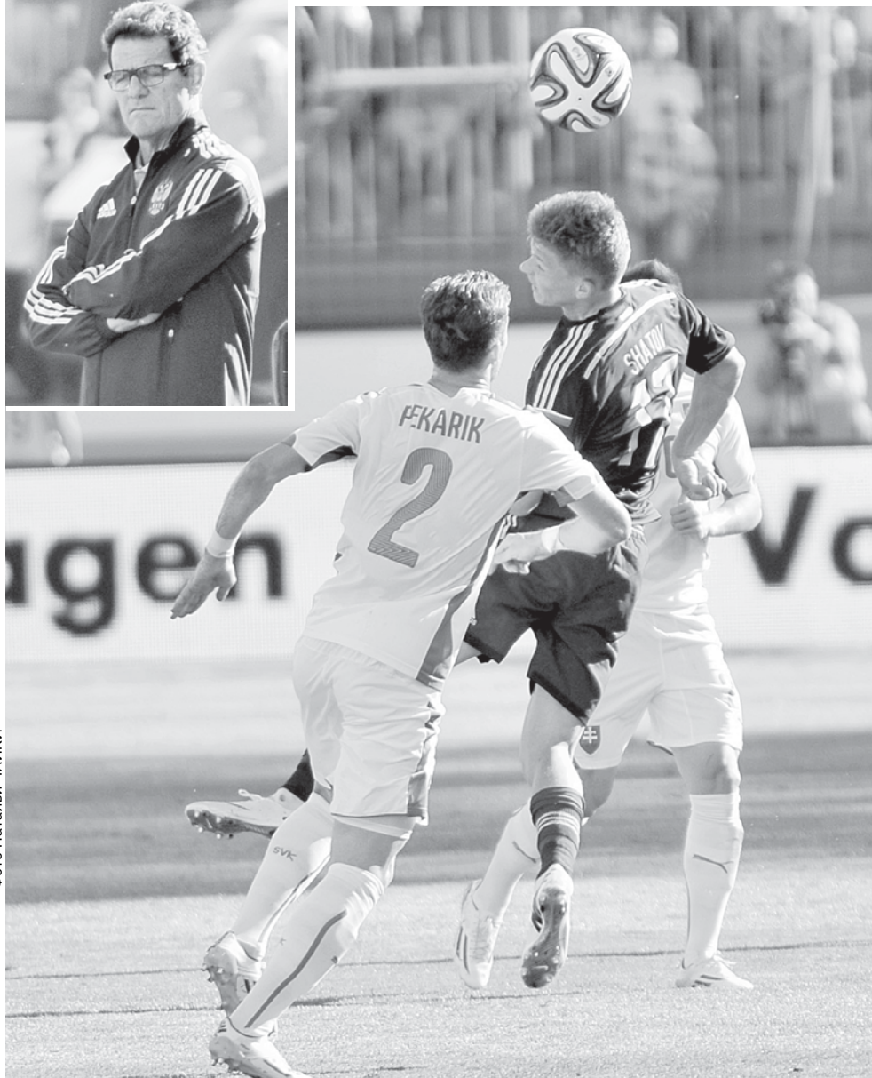
Фабио Капелло серьезно обновил состав сборной.

но воплощают-то их на поле игроки. Может, мы пока чего-то не видим. К тому же Капелло серьезно обновил состав сборной. Игроков, умеющих ярко атаковать, было больше в сборной Адвокаата. Игра этой сборной — более коллективная, с акцентом на порядок.