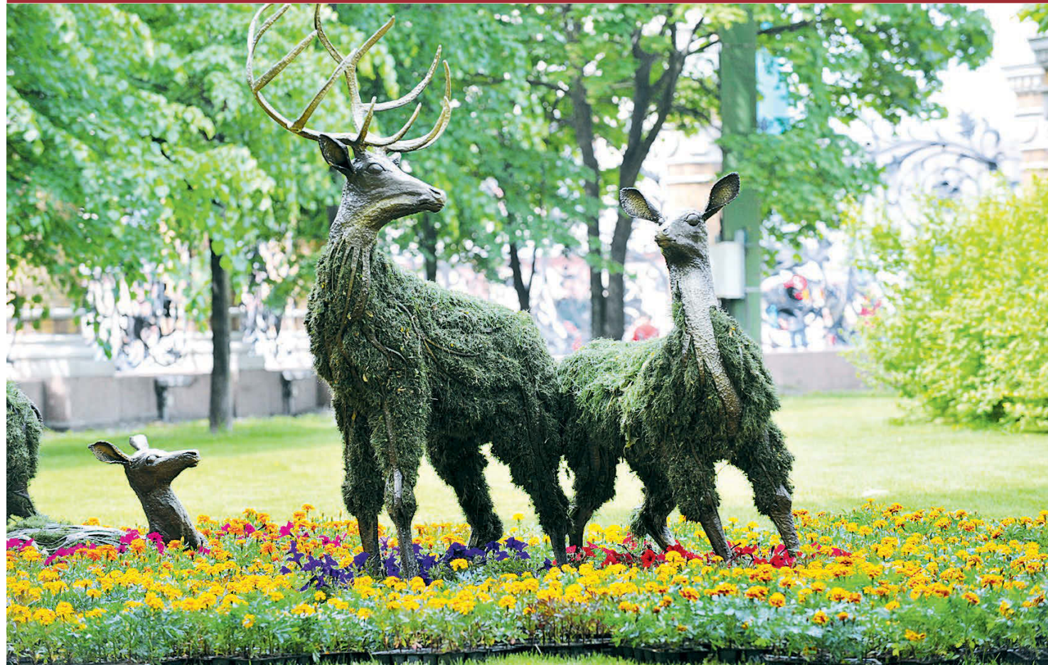
Каждый год участники фестиваля удивляют горожан своим творчеством.