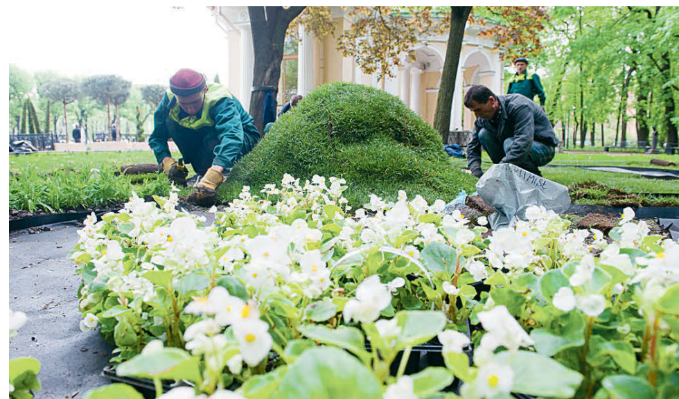
Михайловский сад скоро преобразится.

Подготовила Мишель ЧАПЛИНА