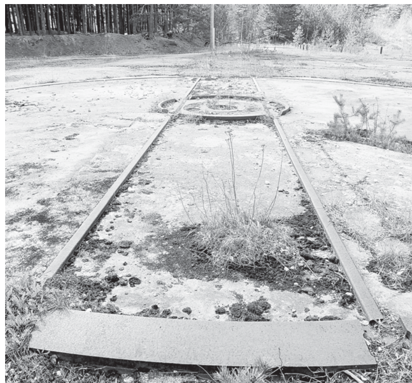
На этом месте раньше стояла гигантская пушка.