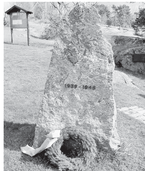
Памятник жертвам Второй мировой войны.