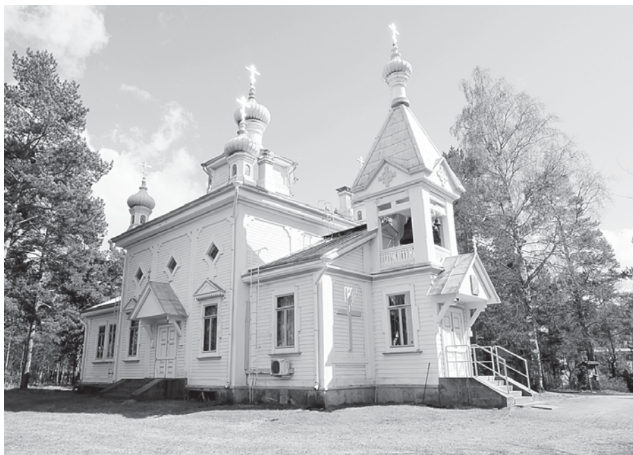
Православный храм в Ханко.