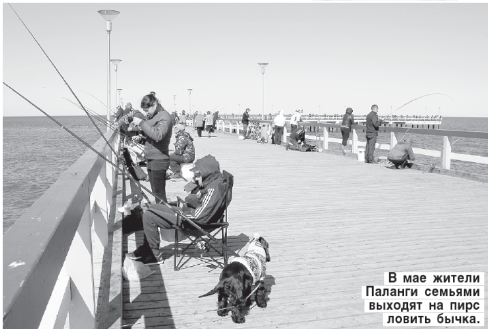
В мае жители Паланги семьями выходят на пирс ловить бычка.

— Праздник корюшки — это визитная карточка Паланги, — узнали мы от мэра Шарунаса Вайткуса.