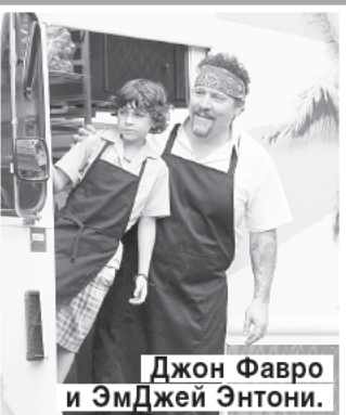
Джон Фавро и ЭмДжей Энтони.