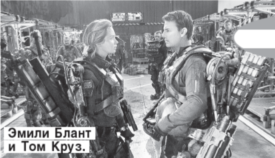
Эмили Блант и Том Круз.