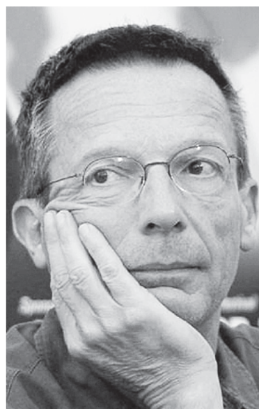
Смотрите на экранах фильм Патриса Леконта «Обещание».

жила Ребекку Холл на главную роль. Я ее видел только в «Вики Кристина Барселона» Вуди Аллена. И когда мы встретились в первый раз, мне показалось, что она очень похожа на «девушку из соседней квартиры», и я подумал, что вряд ли она сможет сыграть Шарлотту. Но потом мы увиделись еще раз, она прошла пробы, и случилось какое-то чудо. Было удивительно, как эта жизнерадостная молодая женщина, которая пришла на съемочную площадку в спортивных брюках, умеет трансформироваться. В костюме, с причешкой и в гриме она превратилась в свою героиню. Ричард Мэдден — очень молодой актер, популярность к которому пришла после съемок в сериале «Игра престолов». Его герой в сериале носит бороду, и в нем есть нечто необузданное. Я спрашивал себя, будет ли он столь же привлекателен, если эту бороду сбрить. Сможет ли он сыграть бедного молодого оппортуни-