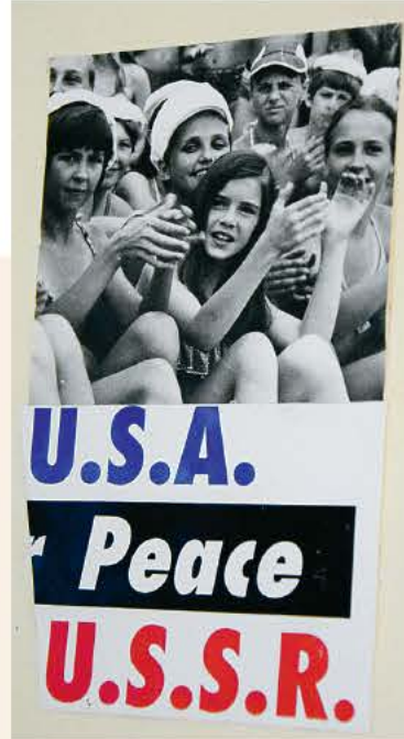
Уникальные кадры хроники, которые можно сегодня видеть в стенах киностудии,