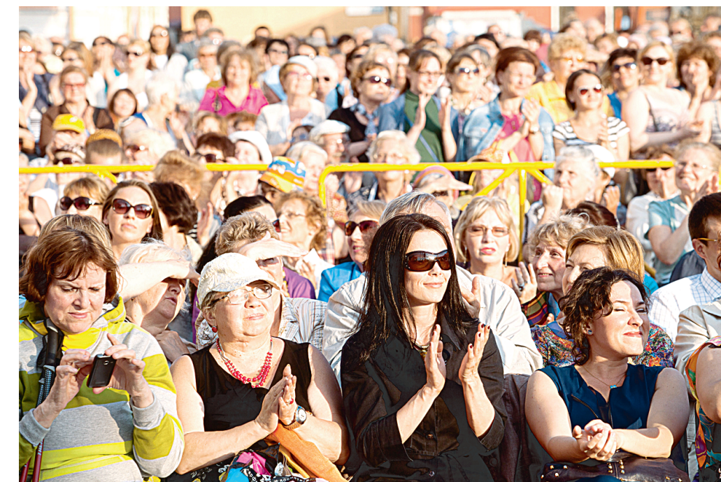
После Римского-Корсакова под открытым небом зрители наверняка захотят услышать Бетховена и Чайковского.