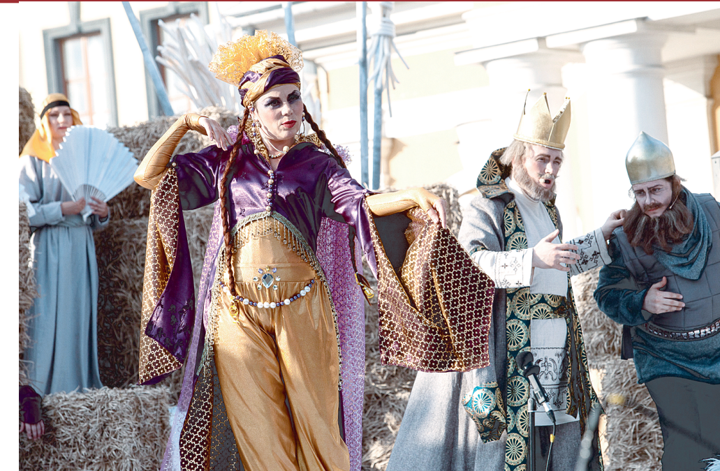
Артистам Мариинского театра, Театра оперы и балета Консерватории, «Санкт-Петербургской оперы» и «Зазеркалья» пришлось работать как эстрадикам — с микрофонами, иначе было не слышно.