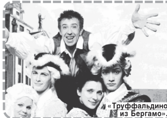
«Труффальдино из Бергамо».