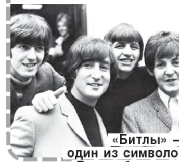
«Битлы» — один из символов Великобритании.

Программа мероприятий — на сайте www.liblenina.ru или по тел. 232-40-62.