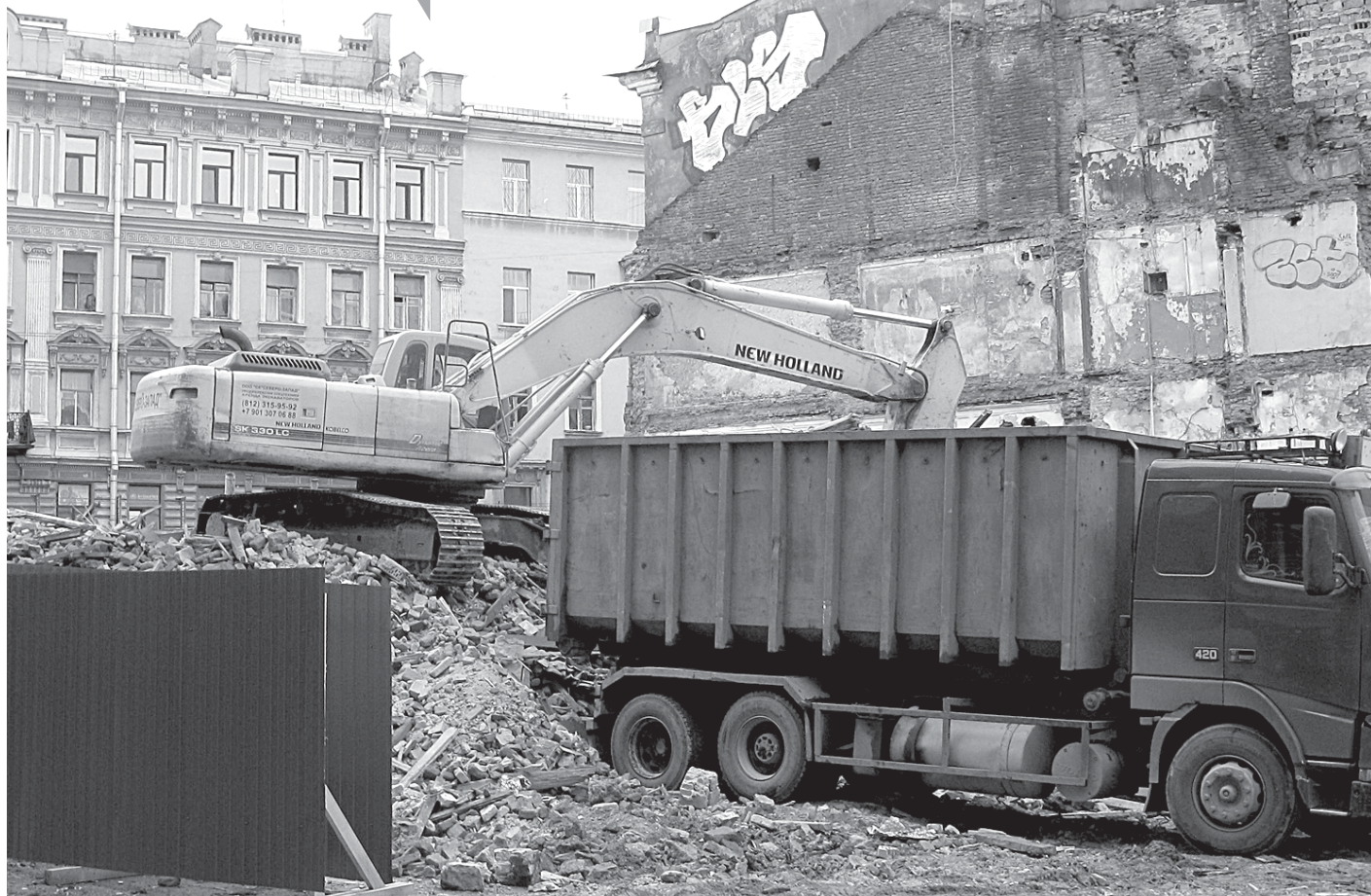
Исторический дом Рогова, увы, исчез навсегда.

Первый этаж нового дома Рогова, вероятнее всего, займет торговля. Магазины и лавки находились тут и в пушкинские времена. За домом авторы проекта