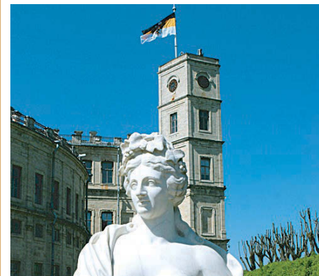
Гатчина прекрасна в любое время суток.

Театрализованные представления, лазерные и проекционные шоу ждут посетителей Гатчинского парка в эту ночь у Адмиралтейства и Березового домика, на Острове Любви и у колодца Иордань, у Водного лабиринта и в Ботаническом саду. Тема-