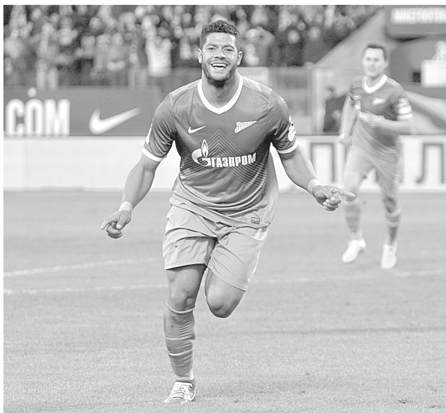
Свой первый матч в Лиге чемпионов «Зенит» сыграет в Ларнаке против местного АЕЛа.

Ответный матч в Лиге чемпионов против АЕЛа состоится 6 августа в Санкт-Петербурге на «Петровском». Насчет его даты и места сомнений нет.