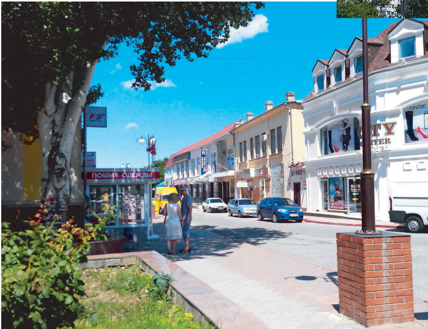
В Керчи на каждом доме — российские флаги, а триколоры есть даже в огородах.

«Какой еще отдых!» — возмущался крепкого телосложения российский мужчина. — Если у вас до этого не было проблем, то они сейчас появятся». Подействовало. Мотор завели.