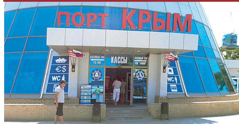
Порт Крым первым сменил украинские вывески.