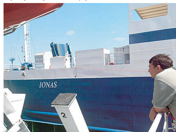
Команда греческого парама «Ионас» не пропустит сиесту...

Честно сказать, когда наше правительство объявило о том, что билеты в ставший российским Крым будут дешевыми, верилось с трудом. Ну когда такое было, чтобы цены снижались? Разве только при Сталине. Но оказывается, нет ничего невозможного, не только реки, но и цены можно повернуть вспять!