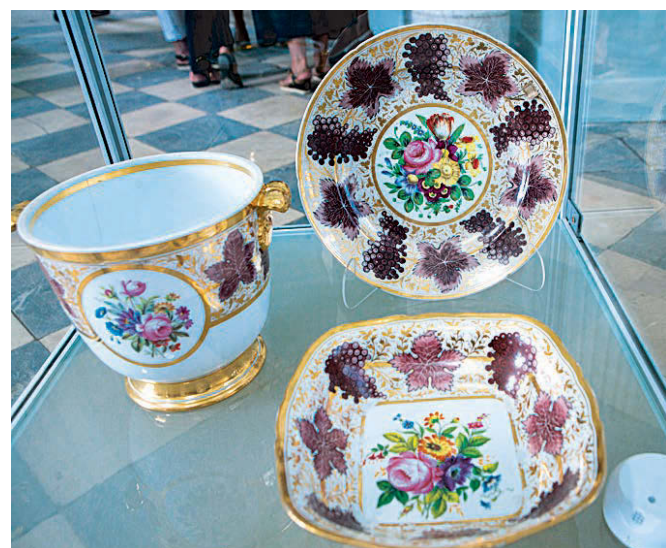
Предметы из «Корбиевского» сервиза. 1820-е гг.

«Грот» найти очень легко. Сразу от центральных ворот нужно пройти по аллеям Екатерининского парка вперед до Большого пруда, в котором лениво плавают размокшие жары утки. А в «Гро-те», голубом с золотом расстреливском павильоне, окунаешься в благословенную прохладу. Драгоценные фарфоровые изделия из коллекции ГМЗ «Царское Село», помнящие роскошные пиры и се-