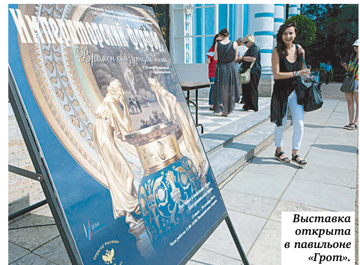
Выставка открыта в павильоне «Грот».