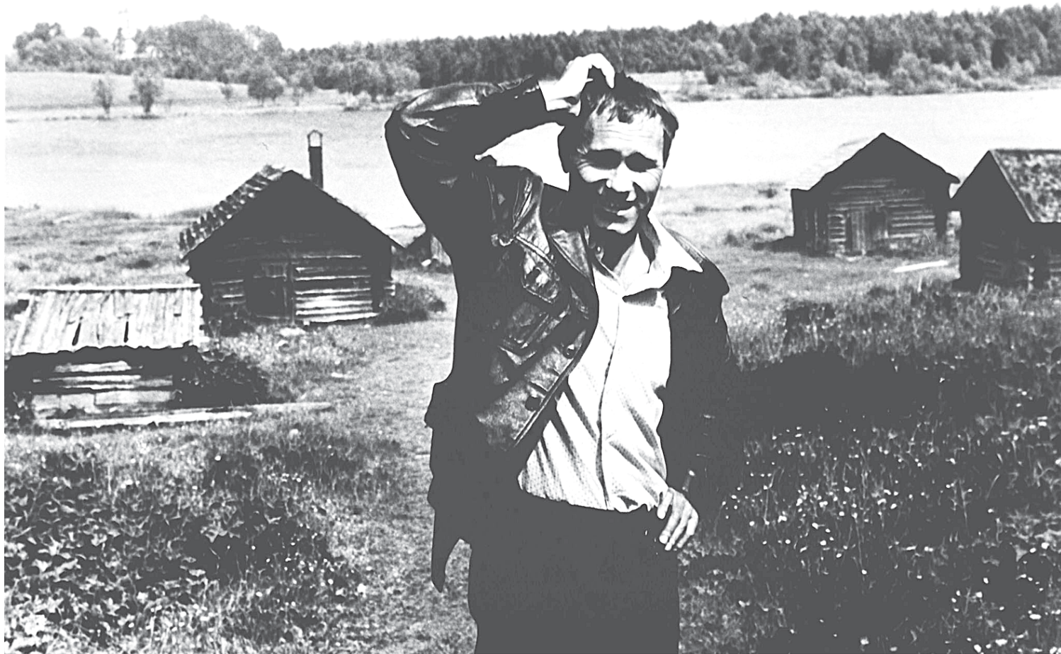
Василий Шукшин. Алтай.