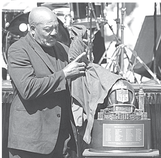
Джим Браун у чемпионского трофея «Кливленд Браунз» 1964 года.