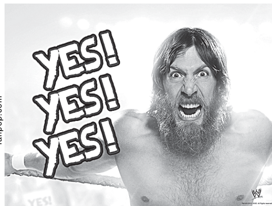
Рестлер Брайан Даниэлсон.