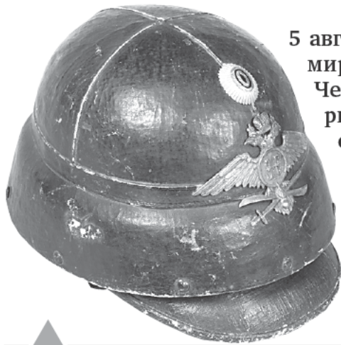
Шлем летчика. 1914 — 1918. Россия. Кожа, металл, фланель, коленкор, ткань х/б. Дар А. Д. Гнедовского.

5 августа 1914 года новорожденной Первой мировой войне исполнилось девять дней. Черногория объявила войну Австро-Венгрии; это была лишь одна из вспышек той огненной пучины, в которую тогда втягивалась вся планета. Россия уже пять дней как находилась в войне. И хотя до первых смертей русских солдат, до битвы при деревне Сталлупенен, оставалось еще двенадцать дней — выхода из этой смертельной ловушки для страны уже не было.