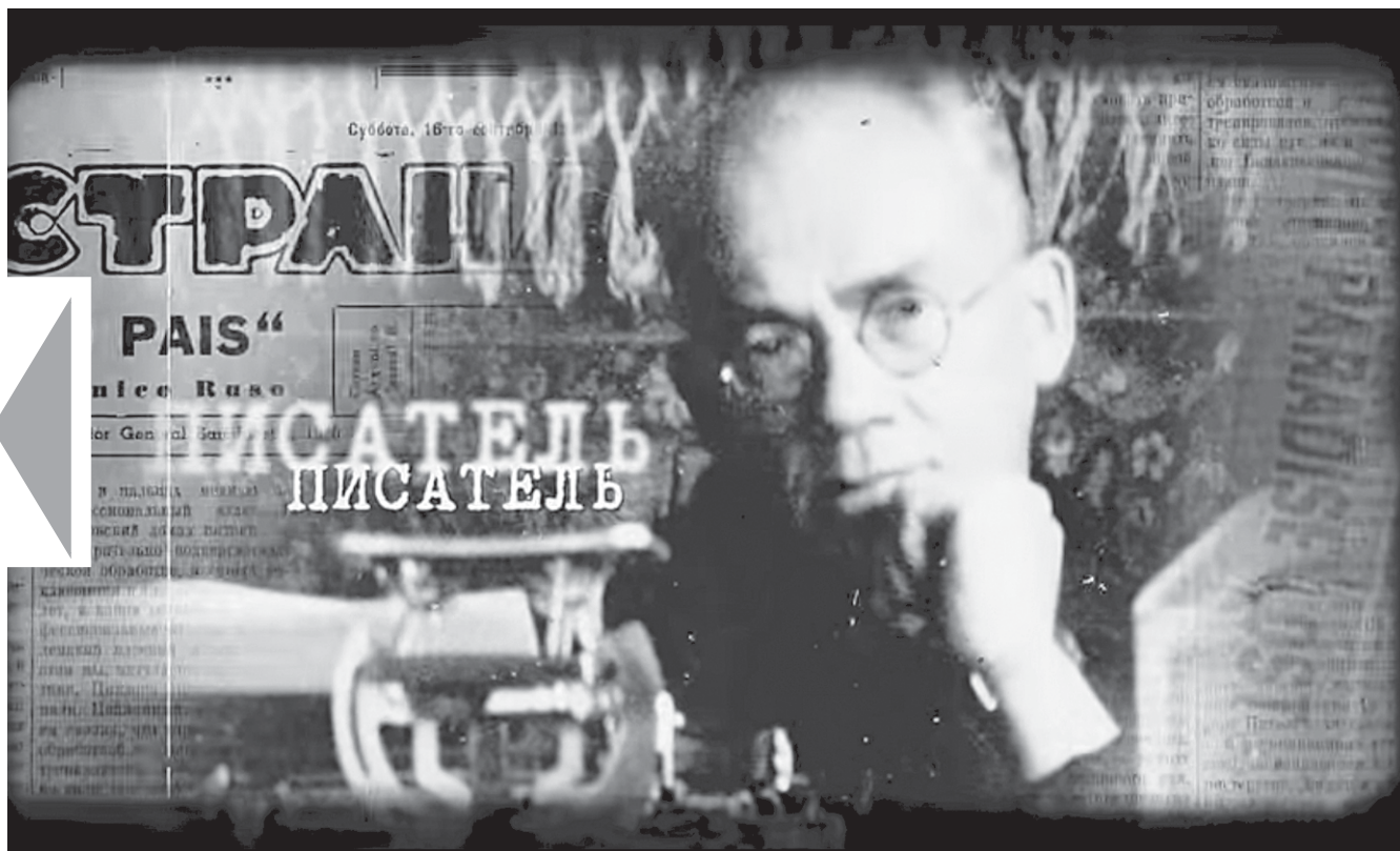
Кадр из документального фильма «Последний рыцарь империи».

Кто же он, этот последний рыцарь империи? Это публицист, политический деятель и спортсмен, крупнейший идеолог русского самодержавного монархизма Иван Солоневич. По словам режиссера, «Диоген, Джеймс Бонд и Остап Бендер в одном лице». В России о нем знают мало: в советское время его труды и даже имя находились под запретом. И неудивительно: отношения с советской властью у него не сложились, как не складывались и с правительствами всех других стран, где ему довелось жить.