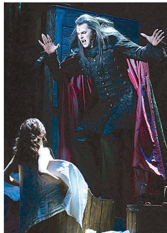
В спектакле использовалось 270 оригинальных костюмов.