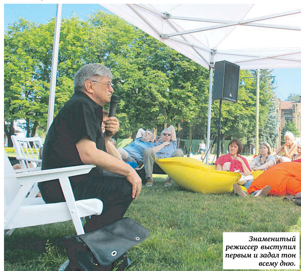
Знаменитый режиссер выступил первым и задал тон всему дню.