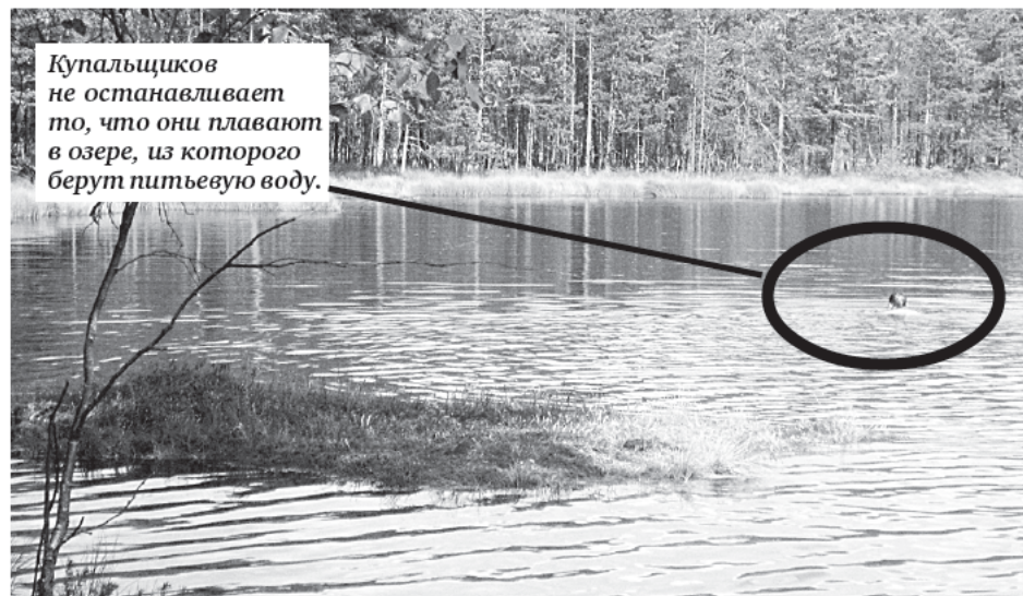
Кстати, в болоте очень любят жить гадюки. И они тоже умеют плавать!

Ежедневно в заказнике «Болото Ламмин-Суо» снимают показания с более пятидесяти точек наблюдения. Отслеживают, как идет испарение влаги, как колеблется уровень болота, что происходит с торфяным слоем и прочее. Все эти данные нужны не только для науки, но и для сугубо практических вещей. В том числе для проектирования различных коммуникаций, дорог, газопроводов, проходящих через болота. Данные по болотам из других регионов для наших болот не подойдут.